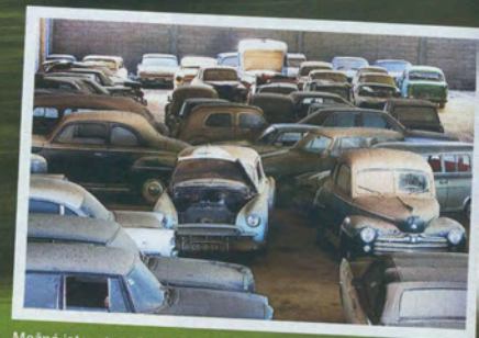
Možná jste o tom četli: Alfa pochází z rozsáhlé sbírky aut, která vznikala přes 30 let v Portugalsku.